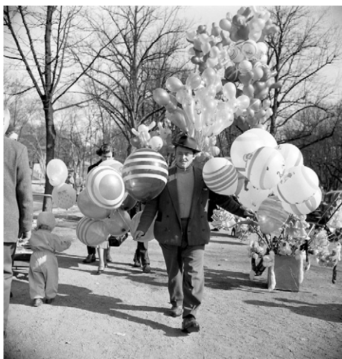
Djurgården i vår hjärtan? SvDs fotograf John Kjellström fotograferade ballongförsäljaren utanför Skansens entré den 30 mars 1956.

Efter årsmöte och föredrag följer en två-