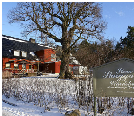
Stora skuggans Wårdshus