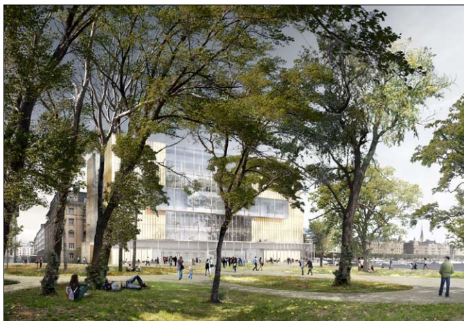
Förslaget till det nya nobelcentret.

Vårt innehållsrika program fortsätter vid kaffet efter middagen med tillkännagivandet