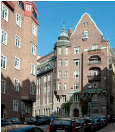
Ovan: Eriksbergområdet. Tv: P O Hallman.

Resultatet erbjuder en välkommen kontrast till Östermalms centrala delar, med dess storskaliga, stränga rutnät. Höstgillet i år äger rum just på Eriksbergsgatan, i gamla Whitlockska skolan.