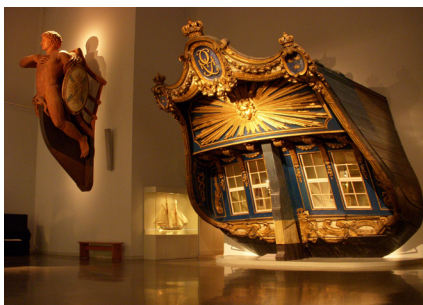
Sjöhistoriska museet i Stockholm, den bevarade akter-spegeln från Gustav III:s lust- och stabsfartyg Amphion.

Museet på Ladugårdsgärdet invigdes 1938. Det hade föregåtts av mångåriga diskussioner och till slut en tävling mellan tre in-bjudna arkitekter, Ragnar Hjort, Cyrillus Johansson och Ragnar Östberg. Johansson hade bakom sig bland annat Vinlagret på S:t Eriksgatan och det mäktiga huset med den svängda tegelfasaden i hörnet Svea-